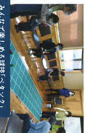
みんなが楽しくめる球技「ペタンク」

※サロニンストラクター養成研修とお伝えください。 ※募集定員40名。お早めに申し込みをお願いします。