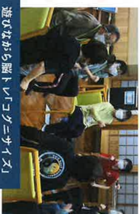
遊びながら脳トレ「コグニサイズ」